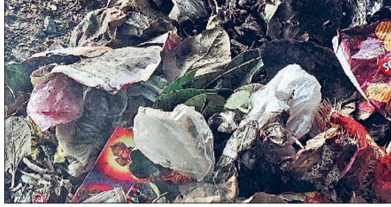
रोहतक। नहर के किनारे पसरी गंदगी।

प्रमाण हैं कि लोग जल की पवित्रता और उसके महत्व को भूलते जा रहे हैं। यह स्थिति केवल एक स्थानीय समस्या नहीं है, बल्कि एक बहु-जनपदीय संकट का रूप ले सकती है। बताया गया है कि यही नहर का पानी रोहतक, झज्जर, दादरी, महेन्द्रगढ़ और रेवाड़ी जिलों में पीने व सिंचाई के लिए भेजा जाता है। यदि इस पानी में निरंतर रूप से कचरा व अपशिष्ट सामग्री मिलती रही, तो यह जनस्वास्थ्य पर गहरा