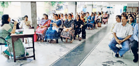
रोहतक। सेमिनार में मौजूद शिक्षिकाएं।