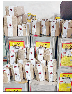
रोहतक। छापेमारी के दौरान टीम को फैक्ट्री से मिला सामान।